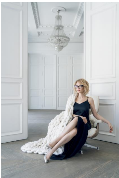
4. Платье, Ester Abner, туфли из серебристой кожи на каблучке 10,5 см, Evelina Khromtchenko & Ekonika, плед, очки и украшения собственность модели, кресло Lounge chair by Charles & Ray Eames, Vitra