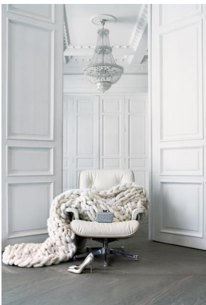
5. Клатч, покрытый серебряным глиттером, туфли из серебристой кожи на