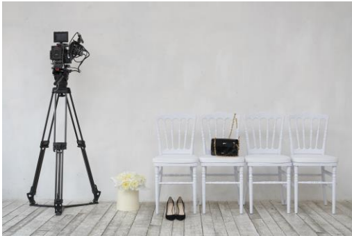
3. Туфли из черной замши, на каблучке 10,5 см, сумка из лаковой кожи с двумя золотистыми цепочками, Evelina Khromtchenko & Ekonika